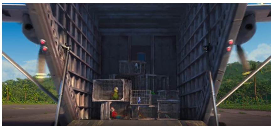
Figura 1 – Gaiolas com aves apreendidas: destaque do cativeiro e da violência do tráfico

Fonte: Rio . Direção: Carlos Saldanha. EUA: 20th Century Fox, 2011