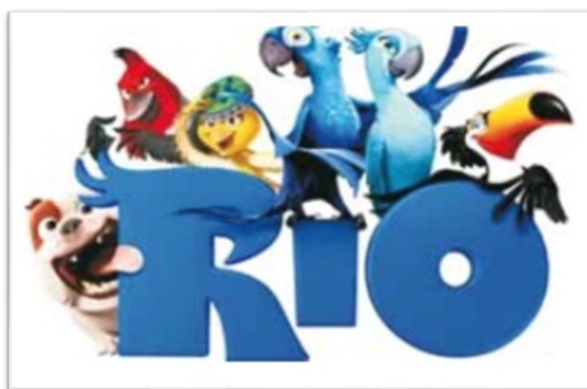
Figura 2 – Paleta de cores e musicalidade: o lúdico em tensão com a denúncia ambiental

Fonte: Rio . Direção: Carlos Saldanha. EUA: 20th Century Fox, 2011